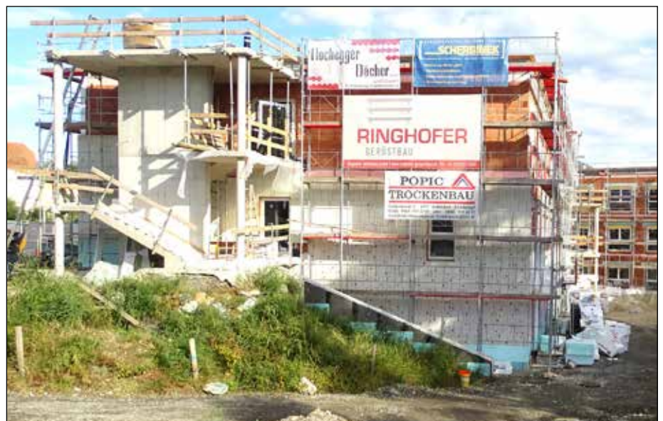
Das Pflegeheim in Pischelsdorf wird im Frühjahr 2022 eröffnet werden.