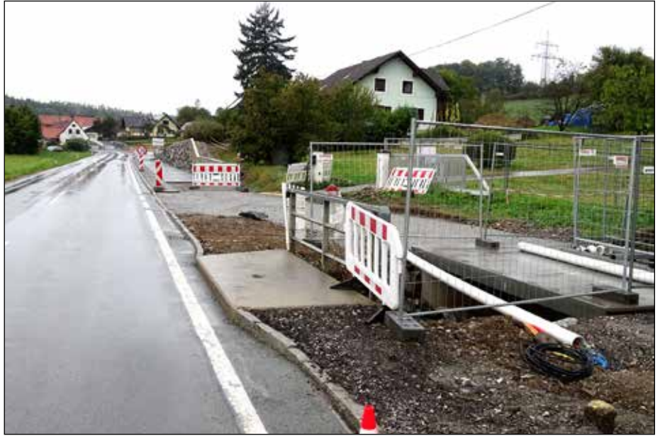
Der Radweg nach Gersdorf wird im Spätherbst durchgehend befahrbar sein.

Bgm. Pillhofer: Der letzte Bauabschnitt des Radweges in Richtung Gersdorf wird heuer im Spätherbst fertiggestellt sein. Damit ist die Lücke geschlossen und es wird möglich sein, auf dem Radweg R4 von Pischelsdorf durchgehend