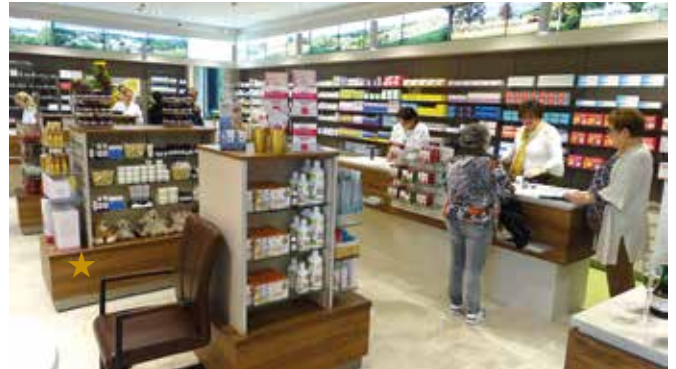
Der erweiterte Kundenraum der Kulmland-Apotheke im ehemaligen Volksbankhaus in Pischelsdorf.

★ ★ Das Team der Kulmland-Apotheke ★ ★ wünscht allen ein besinnliches Weihnachtsfest und ein gesundes und erfolgreiches neues Jahr! ★ ★