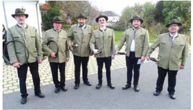
Die Jagdhornbläsergruppe Stubenberg begleitete musikalisch die Bezirkshubertusfeier.