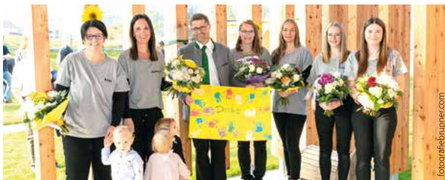
Das Betreuerinnen-Team der Kinderkrippe erhielt vom Bürgermeister Blumensträuße.